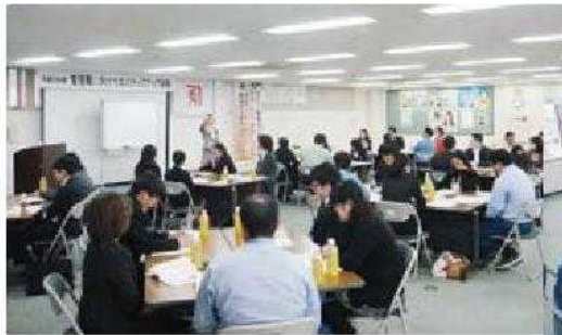
真剣に話し合う受講者たち。研修最後には、個々の決意を発表した。