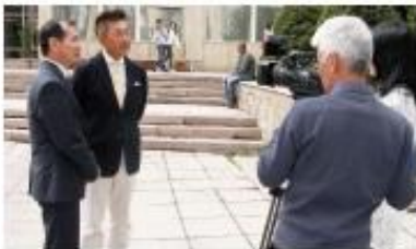
◀現地マスコミの取 材を受けました。現 地での注目度も高ま りつつあります。