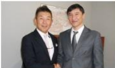
◀キルギス労働青年 省アルマスアンバエ バ副大臣(右)とお会 いすることができま した。