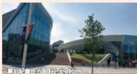
黒川紀章氏が設計した的館