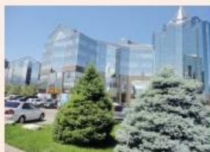
発展目覚ましいオフィス街