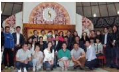
◀日本での就職が決 定した第一期生たち と記念撮影。