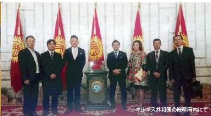
キルギス共和国の総理府内にて