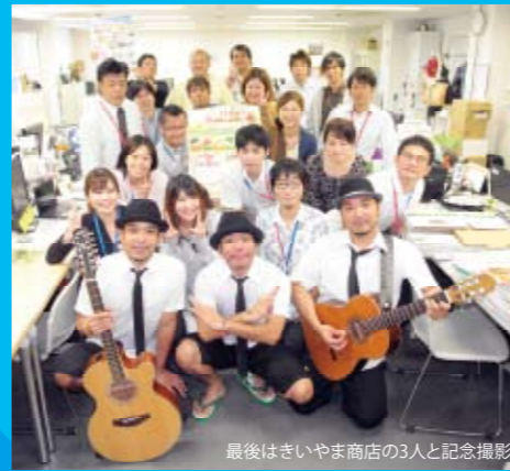
最後はきいよま商店の3人と記念撮影