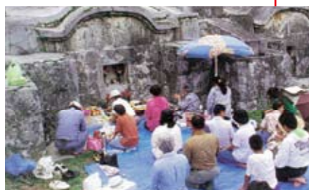
お墓に向かって手を合わせ祈る様子

参考資料:「平成22年度那覇空港観光案内所(国際線)機能強化事業 外国人観光客満足度調査報告書」 発行: (財)沖縄観光コンベンションビューロー