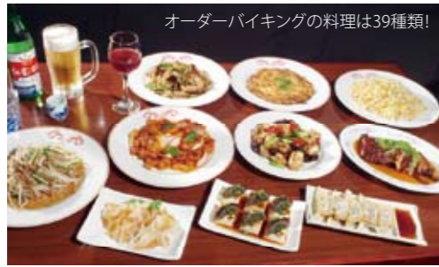
オーダーバイキングの料理は39種類!

中国湖南省料理 湘菜館 沖縄県那覇市西1-5-8 西沖商マンション1F TEL.098-861-1386 【ディナー】17:00~1:30(L.O.24:00) 定休日:無休(お正月休み)