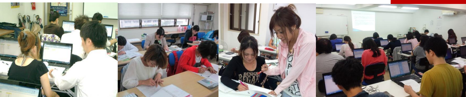
パソコンの授業風景